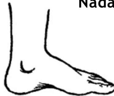
A Pé em Terra Seca