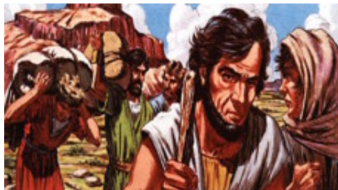
Caim tornou-se um fugitivo